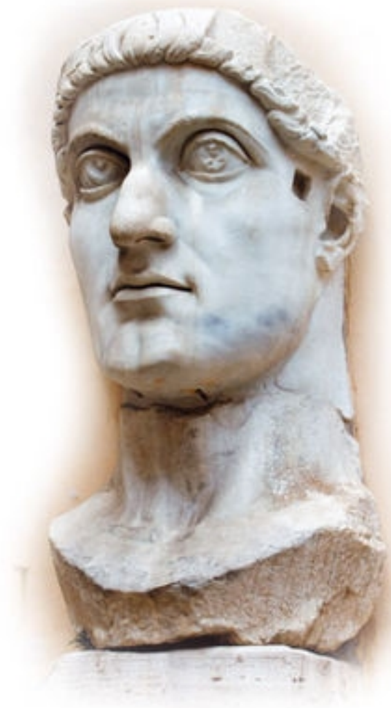
Glava kolosalne statue Konstantina

Ukratko, lako je moguće da se eshatološke bilješke u Novom zavjetu, sam nastanak mita o Isusu, temelje na kometarnim događajima tog vremena, uključujući sjećanje na "zvijezdu na istoku". Uništenje hrama u Jeruzalemu je lako moguće moglo biti "Božje djelo", kao što je to prenio Marko u svom evanđelju, ali ne baš točno onakvo kako pravi vjernici misle da je bilo.