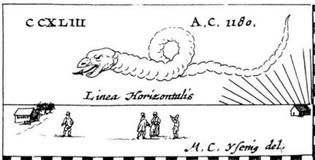
23. Illustrations of two important historical comets taken from Lubienietki's Universal History of All Comets , 1681. The AD 1000 illustration shows a blazing thunderbolt with a 'long drawn out tail landing in open space', having 'fallen from a dragon-like comet with a horrendous tail'. The AD 1180 comet was viewed with horror since it had the appearance of a winding serpent with gaping jaws.

... [U]nutar zadnjih nekoliko godina otkriveno je da postoji veliko jato kozmičkih krhotina koje kruže u potencijalno opasnoj orbiti i