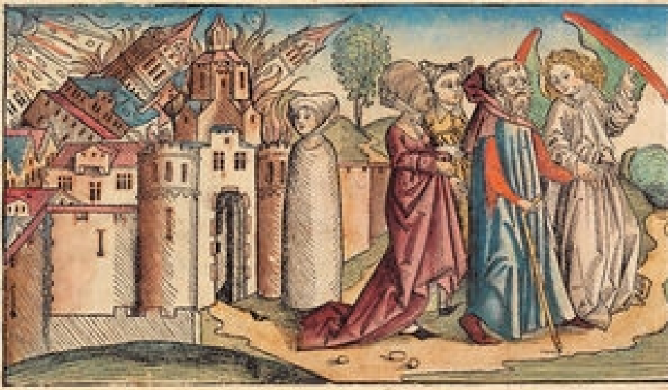
Slika iz "Nürnberških kronika" (1493.)

(Clube i Napier; The Cosmic Winter ; 1990.)