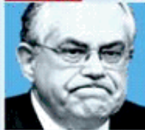
Lucas Papademos Greece's new prime minister; ran the Central Bank of Greece at time of controversial derivatives deals with Goldman that enabled Greece to hide size of its debt.