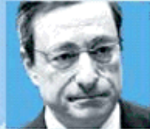
Mario Draghi New head of the European Central Bank; former managing director of Goldman Sachs International