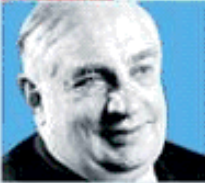
Peter Sutherland Former Attorney General of Ireland; prominent voice during Ireland's bail-out; non-executive director of Goldman Sachs International