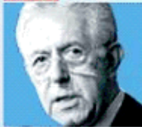
Mario Monti Italy's new prime minister; international adviser to Goldman Sachs