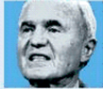
Otmar Issing Former board member of Bundesbank and the ECB; helped create the euro; adviser to Goldman Sachs