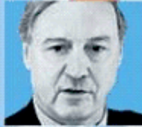
Karel van Miert Former EU Competition Commissioner and ex-international adviser to Goldman Sachs