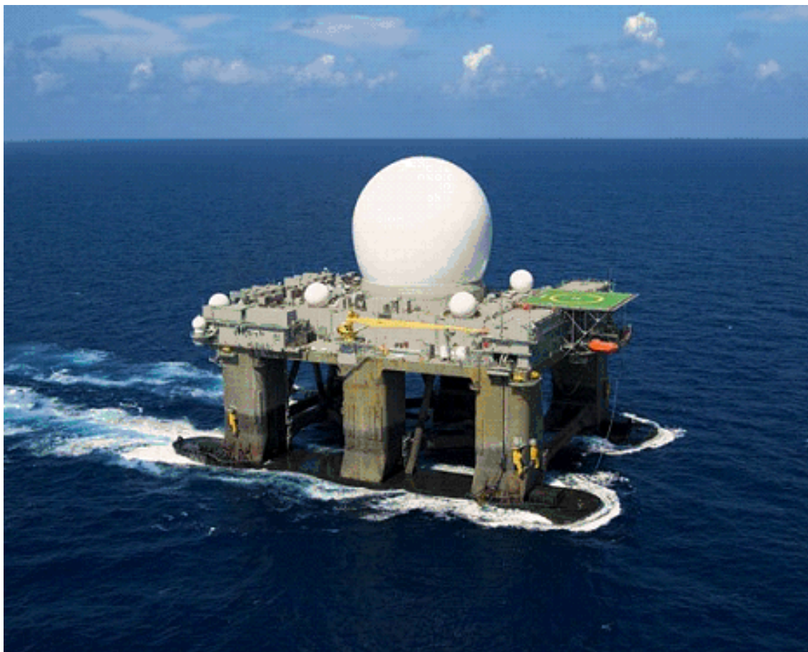
HAARP na ladji

Dokler je HAARP najvišja tajna, ni dokazljiv na sodišču. Torej se najprej svetuje pridobiti znanje o HAARP-u, o njegovih vplivih in moči. Poslušajmo tudi otroke, kateri so lahko podzavestno podvrženi testiranju s HAARP-om. Večino ljudi, ki ima kaj povedati o HAARP-u, se obravnava kot mentalne bolnike. Torej, če se informacije o tem orožju širi na tak način, ljudje nočejo verjeti. Če bo takšna situacija trajala, bo HAARP imel lažji dostop do našega telesa in bo strokovno manipuliral z nami ter razvijal svojo tehnologijo.