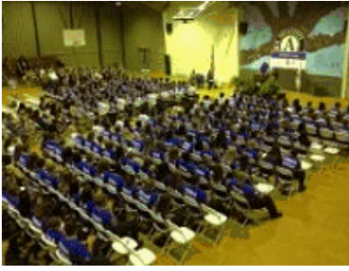
Inauguracija MDS mladeži

Da, 18 godina je općenito punoljetstvo uz pomoć kojeg osoba može potpisati ugovor, u vojnu službu ili mu se sudi kao odrasloj osobi. Ali pitajte bilo kojeg roditelja – za 18, 20 ili čak 24-godišnjaka i reći će vam da je on još uvijek naivan, lako-utjecajan klinac.