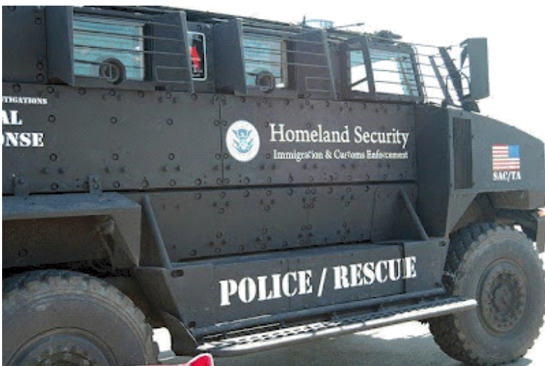
MDS oklopno borbeno vozilo

Pojedinci diljem SAD-a su počeli izvještavati o čudnim, novim, jako naoružanim FEMA borbenim vozilima. Što bi katastrofalna agencija poput FEMA-e trebala sa 2500 novih GLS oklopnih borbenih vozila? Prema podacima Agencije vlastitog mandata, kao i izvršnog reda predsjednika Obame, odgovor je "kontrola stanovništva" u vrijeme ratnog stanja. Jedan set slika koja se učinila dostupnom pokazuje vagone i vagone novih MDS i FEMA oklopnih borbenih vozila, zajedno sa utorima za strojnicu. Oni označeni sa uobičajenom okrenutom američkom zastavom i naslovom "domovinske sigurnost". Ispod toga se nalazi DHS logotip, na kojem također piše, "Provedba imigracije i carine". Slične znake na crnim vozilima s bijelim slovima također prikazuje i POLICIJA / SPAŠAVANJE.