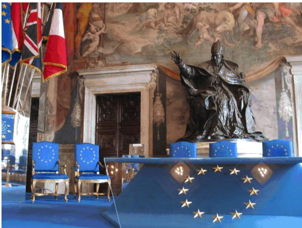
Kapitolski muzej u Rimu

Kao vođa tada najjače stranke u parlamentu ovaj najliberalniji zakon o pobačaju je praktično omogućio Rompuy, unatoč svojim čvrstim religijskim uvjerenjima.