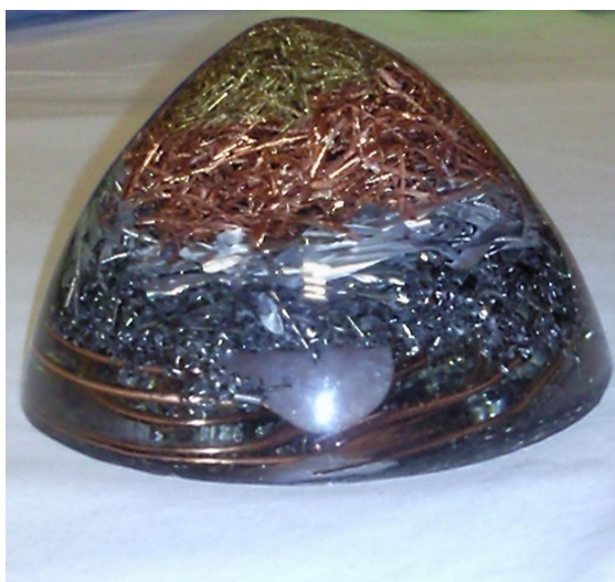
Orgonski generator (stožec)