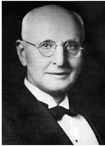
Dr. Weston A. Price

Dr. Price je odkril dodaten maščobno topen vitamin, katerega je poimenoval "Aktivator X" ter so ga tudi ostali poimenovali kot Price faktor ali X faktor, ter se zanj domneva, da gre za vitamin K2. Je močan katalizator, ki kot vitamina A in D, pomaga telesu pri absorbiranju in izkoriščanju mineralov. Prisoten je bil v prehrani vseh zdravih populacijskih skupin, katere je preučeval, na žalost pa je skoraj popolnoma izginil iz moderne zahodnjaške prehrane. Viri K2 vključujejo organsko meso krav, hranjenih z zeleno travo, ribje ikre in lupinarje (školjke). Maslo je lahko posebno bogat vir Aktivatorja X/vitamina K2, če prihaja od krav, ki so hranjene s hitro rastočo sezonsko travo spomladi in jeseni. Izgine pa pri kravah, ki so hranjene z bombažnim semenom ali visoko beljakovinsko hrano na osnovi soje. Na srečo se Aktivator X/vitamin K2 ne uniči pri pasterizaciji.